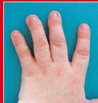
Die gleiche Hand nach Trennung der Syndaktylien III-IV-V