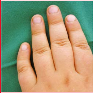
Klinodaktylie am V Finger aufgrund einer Brachymesophalangie

Eine operative Korrektur in Form eines Aufrichtens des Knochens ist bei einer Abwinkelung von mehr als 30 Grad erforderlich oder wenn der betroffene Finger beim Faustschluss den Nachbarfinger überkreuzt.