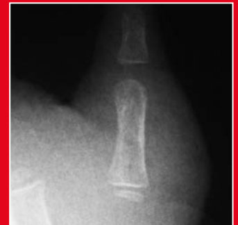
Das Röntgenbild des neuen Daumens