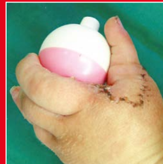
Die gleiche Hand nach Entfernung des hypoplastischen (unterentwickelten) Daumens und Bildung eines neuen Daumens vom Zeigefinger