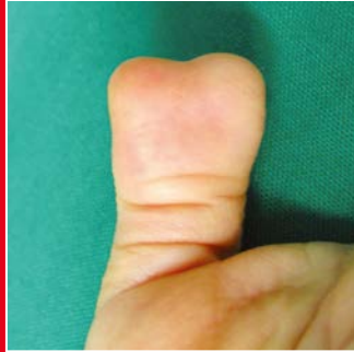
Doppeldauen (radiale Polysyndaktyliedaktylie)