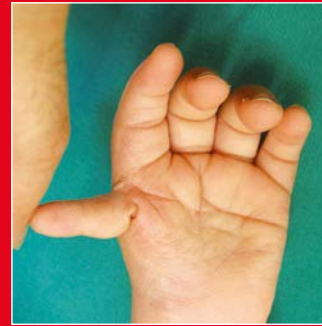
Daumenunterentwicklung Grad IV

Die operative Behandlung hat bei den leichten Formen der Unterentwicklung als Ziel die Stabilisierung und evtl. die Verstärkung des schwachen Daumens. Bei Grad IV oder V ist die Bildung eines Daumens unter Verwendung des Zeigefingers (Pollizisation) angezeigt.