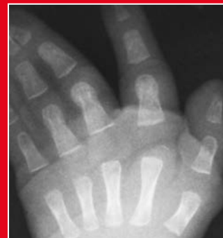
Röntgenbild der komplexen Syndaktylie III-IV und komplette Syndaktylie IV-V