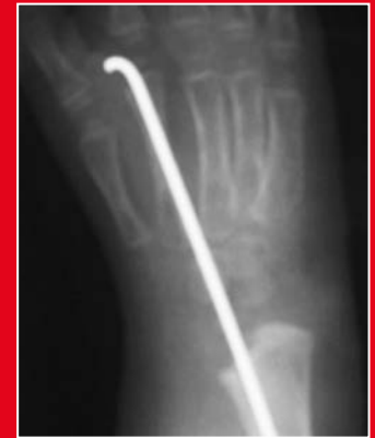
Gleiche Hand nach Radialisation und vorübergehender Drahtfixation