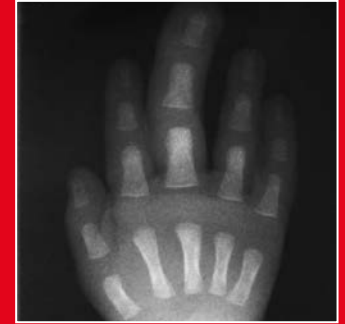
Makrodaktylie des III Fingers