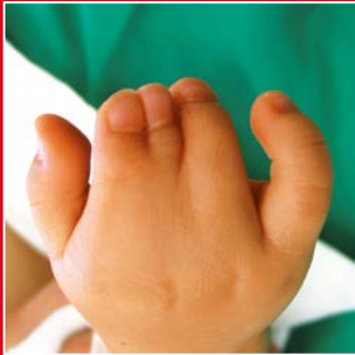
Sybrachydaktylie vom kurzfinger Typ

Eine Sybrachydaktylie tritt fast ausschließlich einseitig auf. Die Kombination mit einer gleichseitigen Unterentwicklung der Brustmuskulatur wird als Poland-Syndrom bezeichnet. Die Therapie besteht in der Trennung der häutigen Verbindung, der Stabilisierung und Verlängerung der zu kurzen Finger.