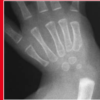
Radiale Abwinkelung des Handgelenkes bei starker Radius-Unterentwicklung

Die Abwinkelung des Handgelenks nach innen (radial) ist bedingt durch eine Unterentwicklung der Speiche oder der die Speiche (Radius) umgebenden Weichteile. Diese Fehlbildung tritt isoliert oder auch im Rahmen eines Syndroms auf. Die operative Behandlung verbessert die Stellung und Funktion des Handgelenkes und damit natürlich auch die funktionelle Einsetzbarkeit der Hand. Die Behandlung besteht in einer frühen Redression (Korrektur ohne Operation, z.B. durch manuelle Therapie) des Handgelenks durch Dehnungsübungen im Säuglingsalter und einer Gelenkdehnung mit Hilfe eines externen Fixateurs (ein durch die Haut von außen („extern“) befestigtes Haltesystem zur Ruhigstellung) und der Einstellung der Elle (Ulna) an der radialen Seite des Handgelenks (Radialisation) im ersten Lebensjahr. Eine Verlängerung der Unterarmknochen wird meistens erst im Schulalter durchgeführt.