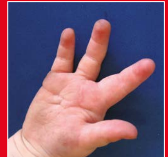
Die gleiche Hand nach Entfernung des vergrößerten Strahles III und Transposition II auf MHKIII.