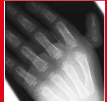
Das Röntgenbild der Daumenunterentwicklung Grad IV