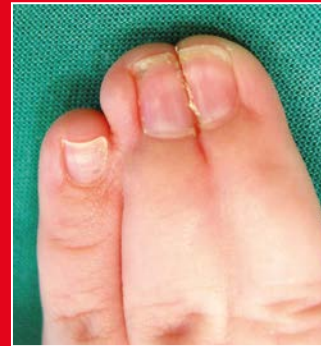
Komplexe Syndaktylie der Finger III-IV und komplette Syndaktylie der Finger IV-V

Bei der chirurgischen Trennung zweier Finger muss eine neue Zwischenfingerfalte gebildet werden und die entstandenen Hautdefekte an den Fingerseitenflächen müssen mit einem Hauttransplantat gedeckt werden.