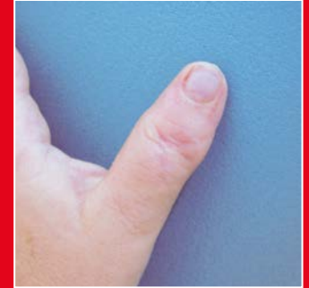
Gleiche Hand nach Korrektur