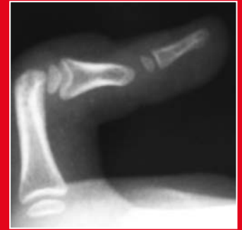
Kamptodaktylie des V Fingers mit dem typischen Röntgenbild