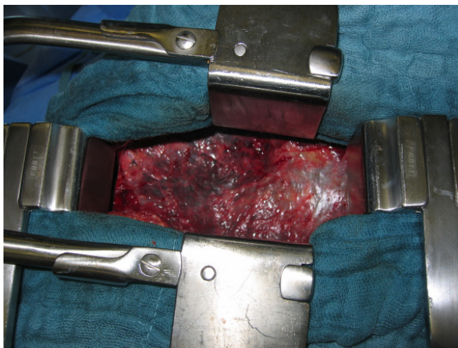
Anterolaterale Thorakotomie, muskelschonend.

Im Fall mehrerer Metastasen ist ein offenes Verfahren im Sinne eines muskelsparenden Schnittes (ca. 8cm) unter Schonung der Nerven und der Rippen der Brustwand indiziert. Dadurch kann der Thoraxchirurg die multiplen Herde eindeutig lokalisieren (digital tasten) und mit Hilfe eines Lasers die Metastasen blutarm und im Gesunden reseziieren