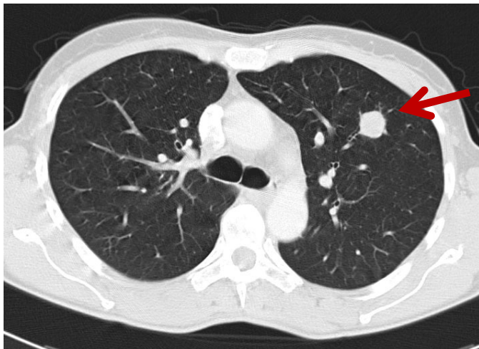
Rundherd Lungenoberlappen links, V.a. Lungenmetastase

Im Prinzip sollte bei jedem Patienten mit einem bösartigen Tumor in der Vorgeschichte und dem V.a. Lungenmetastasen eine Resektion der Lungenmetastasen geprüft werden. Besonders bei einzelnen Lungenrundherde kann es sich um gutartige Herde oder einen Lungenkrebs handeln. Diese erfordern eine eigenständige Behandlungsstrategie mit häufig guten Ergebnissen.