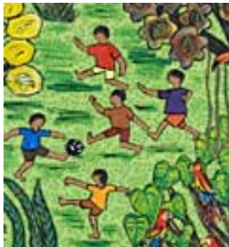
Ausschnitt aus dem Bild „Costa Rica“